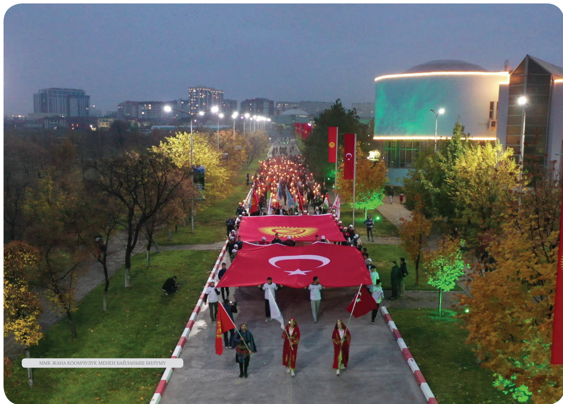
ММК ЖАНА КООМЧУЛУК МЕНЕН БАЙЛАНЫШ БӨЛҮМҮ