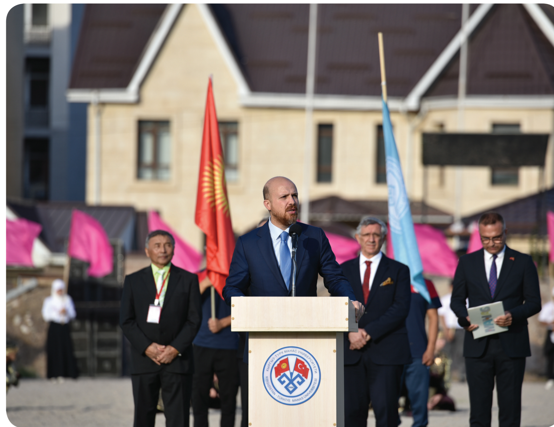
2023-жылдын 12-октябрында Кыргыз-Түрк “Манас” университети менен Бүткүл дүйнөлүк этноспорт конфедерациясы ортосунда кызматташуу протоколуна кол коюлду.

Бул документтин негизинде “Манас” университети менен Бүткүл дүйнөлүк этноспорт конфедерациясы улуттук спортту дүйнө жүзүндө жайылтуу, коргоо жана өнүктүрүү максатында маанилүү кадам ташташты.