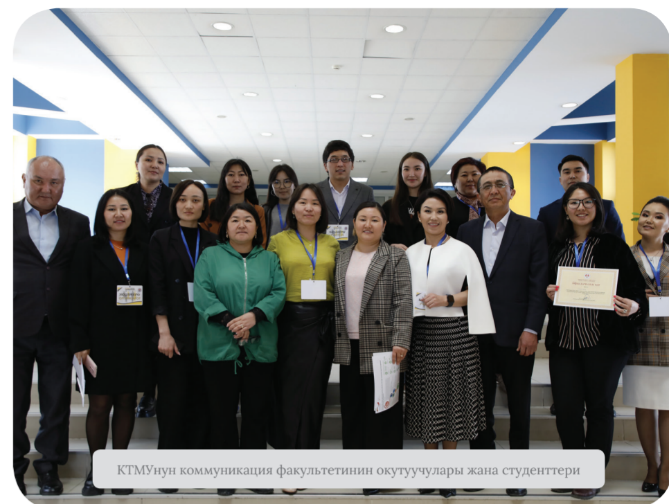
КТМУнун коммуникация факультетинин окутуучулары жана студенттери

- Мактана турганчалык болгон соң айтышыбыз керек. “Манас” бүлөсүндө эл аралык кароо сынактардан көп учурда олжолуу кайткандар – биздин факультеттин студенттери. Жылына ар бир бөлүмдөн он чакты балдарыбыз “КМШнын эң мыкты студенти”,