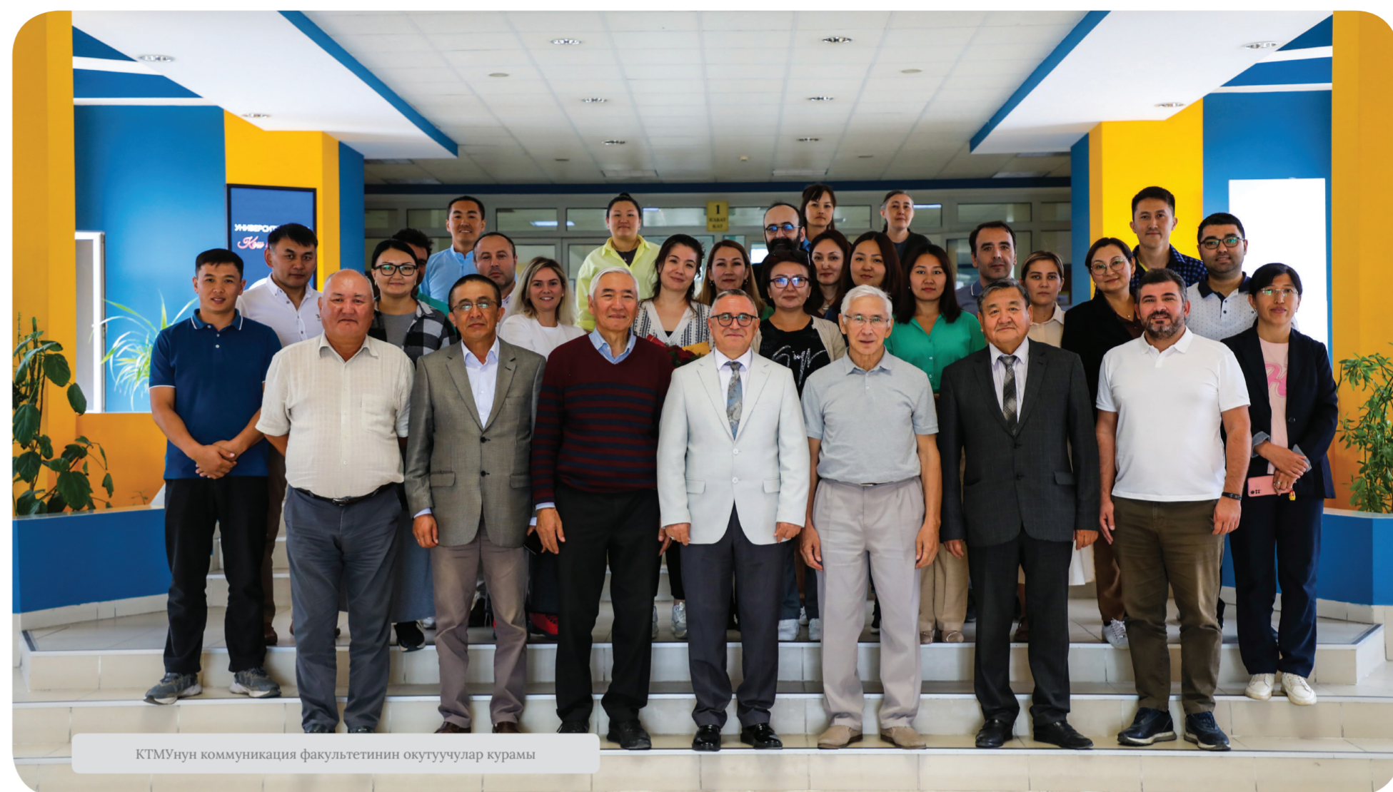
КТМУнун коммуникация факультетинин окутуучулар курамы