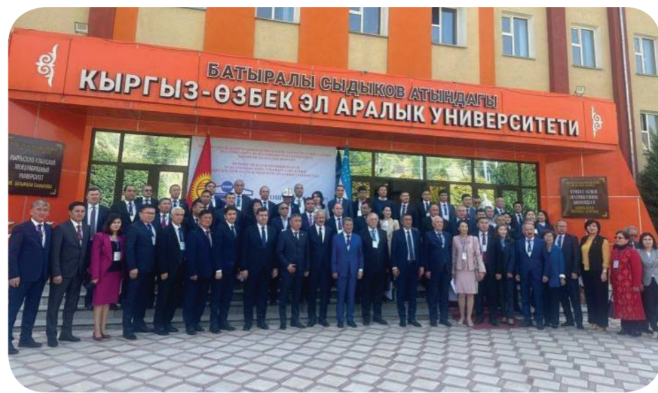
ММК ЖАНА КООМЧУЛУК МЕНЕН БАЙЛАНЫШ БӨЛҮМҮ