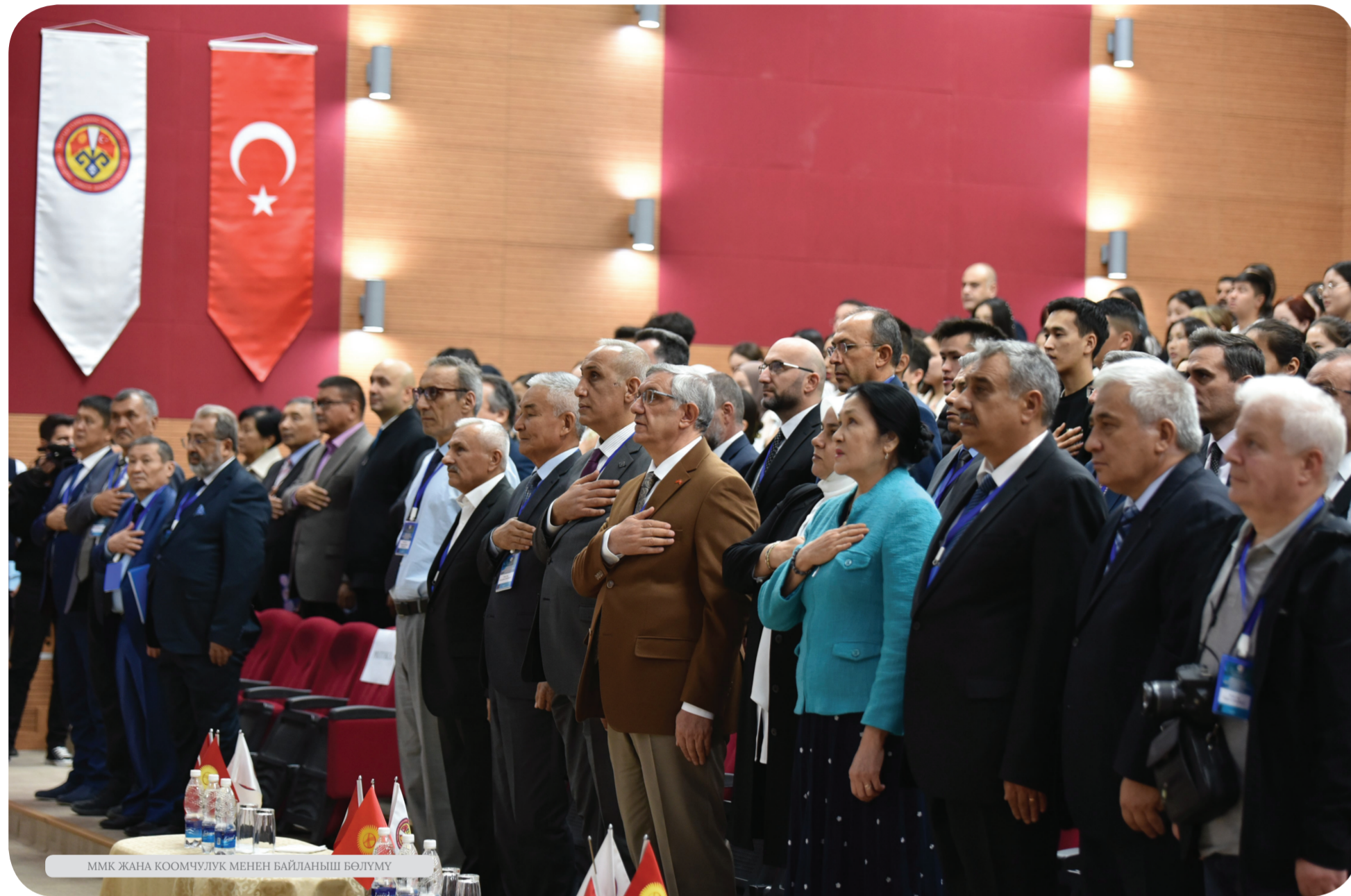
ММК жана коомчулук менен байланыш бөлүмү

2023-жылдын 4-6-октябрь күндөрү Кыргыз-Түрк “Манас” университетинин гуманитардык факультети жана Евразия тил, тарых жана археология илимий-изилдөө институту тарабынан “Түрк элдеринин тарыхы жана байыркы доордогу илимдери” аттуу эл аралык семинар өткөрүлдү.