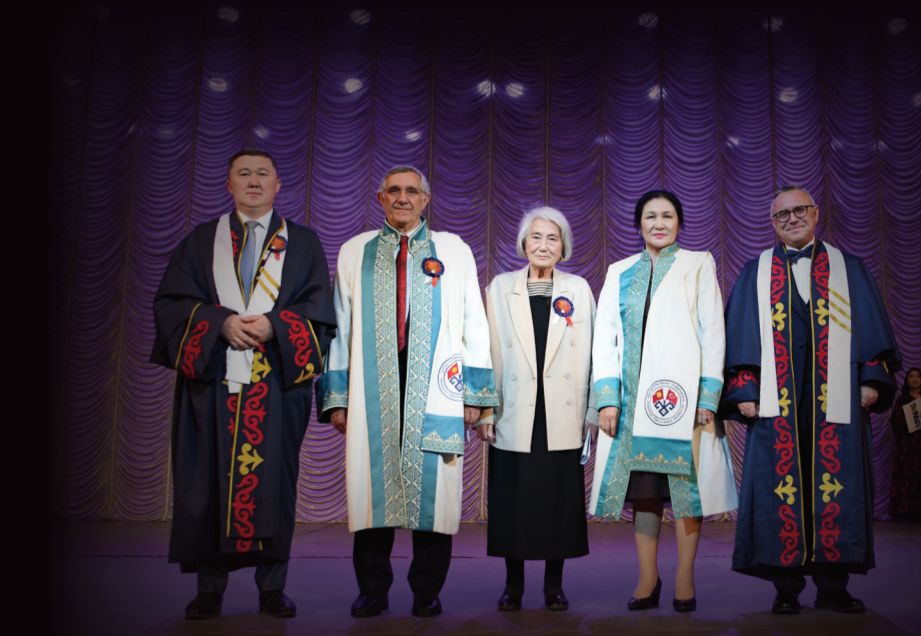
ММК ЖАНА КООМЧУЛУК МЕНЕН БАЙЛАНЫШ БӨЛҮМҮ