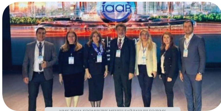
ММК ЖАНА КООМЧУЛУК МЕНЕН БАЙЛАНЫШ БӨЛҮМҮ

2023-жылдын 6-7-октябрь күндөрү Астана шаарында Казакстандын Көз карандысыз аккредитация жана рейтинг агенттиги тарабынан 7-Эл аралык Евразия жогорку билим берүү форуму болуп өттү.