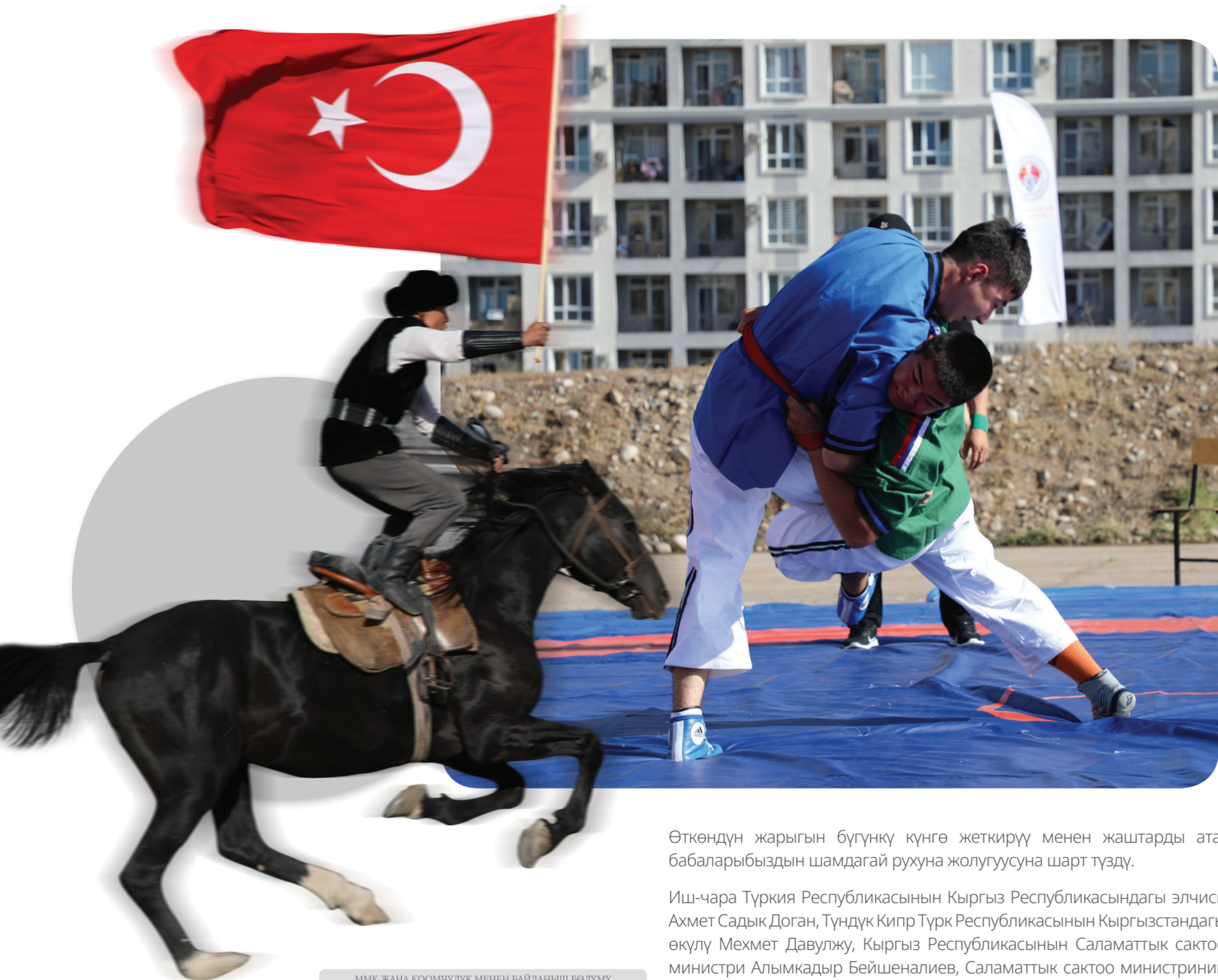
ММК ЖАНА КООМЧУЛУК МЕНЕН БАЙЛАНЫШ БӨЛҮМҮ

Кыргыз-Түрк “Манас” университетинде Түрк дүйнөсүнүн бай мурасы болгон салттуу спорт оюндары жана симпозиуму өткөрүлдү